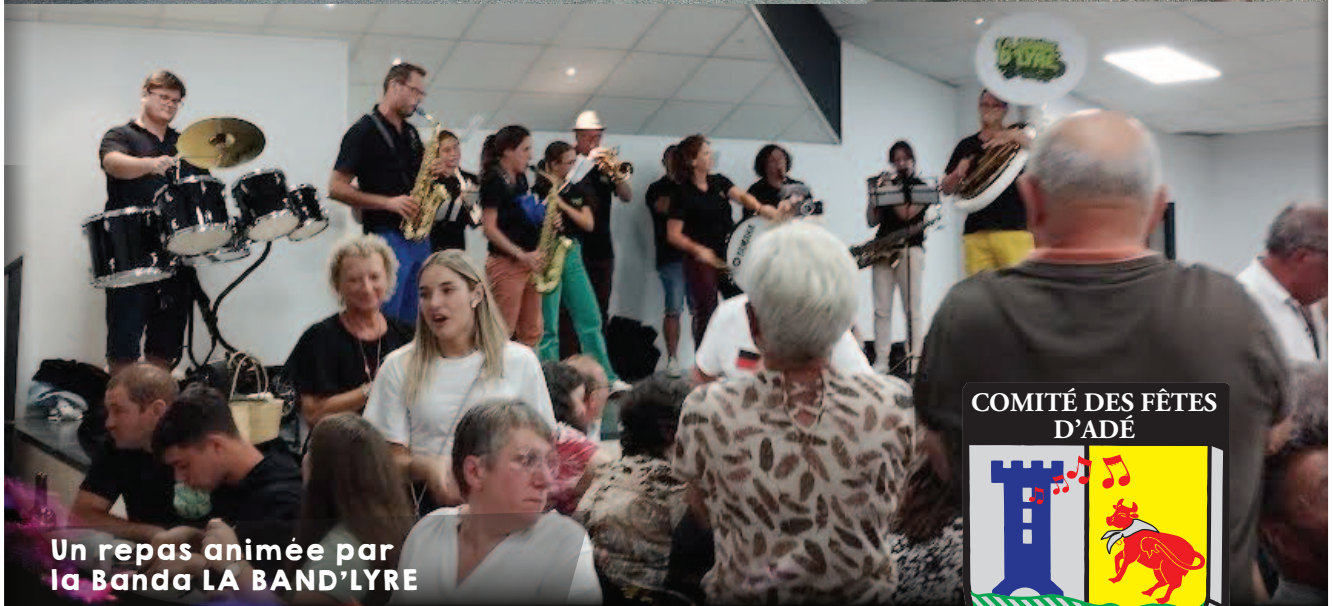
Un repas animée par la Banda LA BAND'LYRE