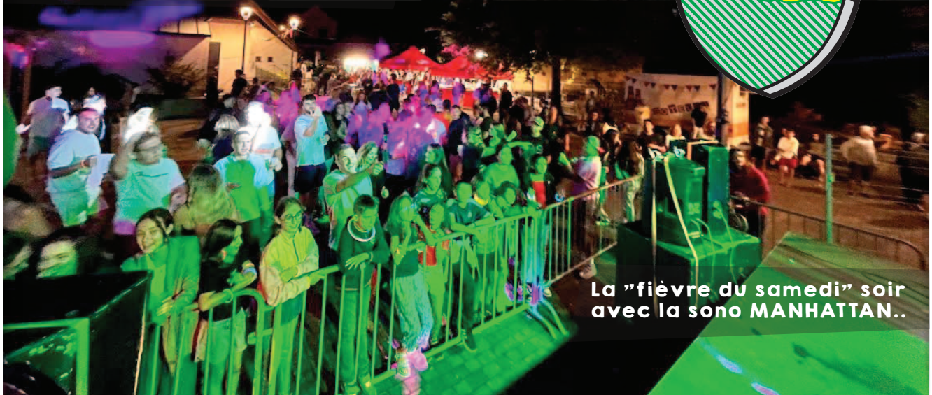
La "fièvre du samedi" soir avec la sono MANHATTAN..