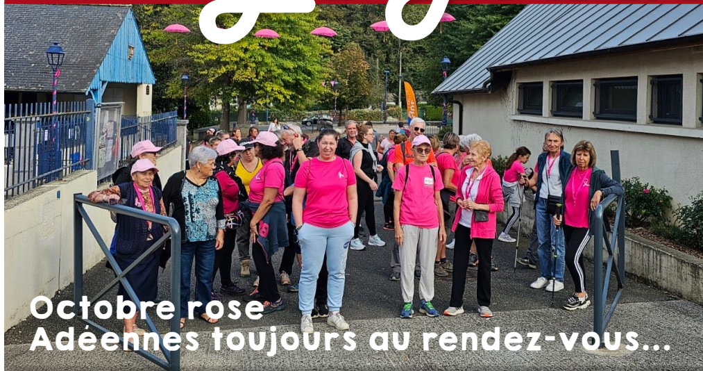
Octobre rose Adéennes toujours au rendez-vous...