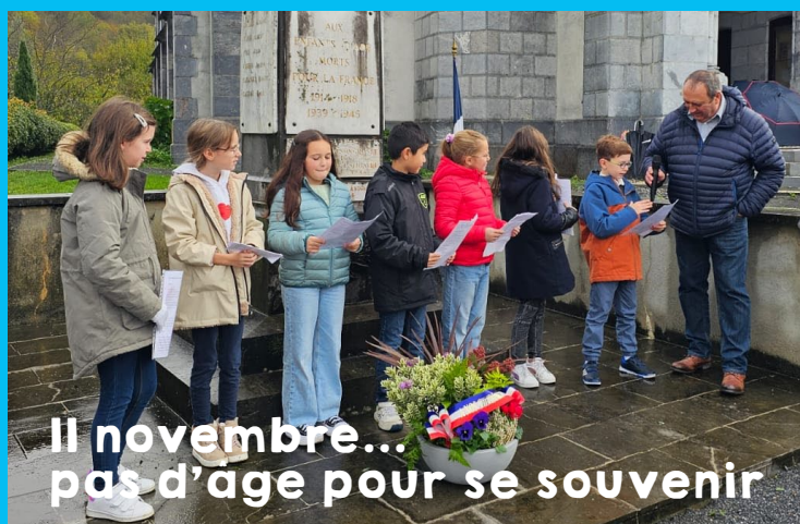
Il novembre... pas d'âge pour se souvenir

Prenez soin de vous et... au prochain journal.