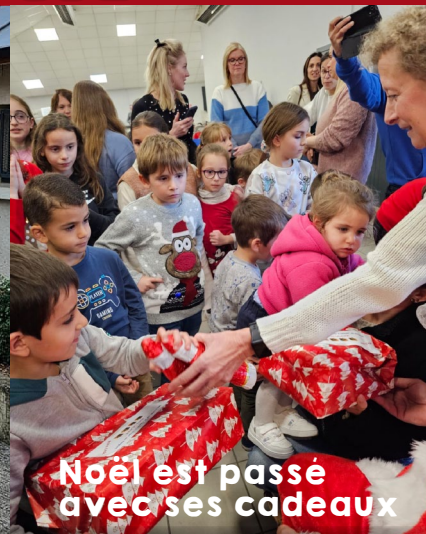
Noël est passé avec ses cadeaux