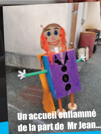
Un accueil enflammé de la part de Mr Jean...

Nous vous invitons à participer à la fête patronale qui se déroulera les 5, 6 et 7 août