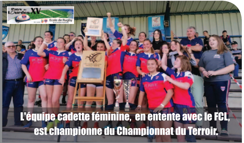
L'équipe cadette féminine, en entente avec le FCL, est championne du Championnat du Terroir.