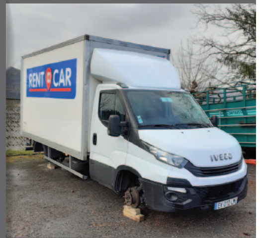
Le véhicule du SIMAJE également attaqué par ces individus malveillants.