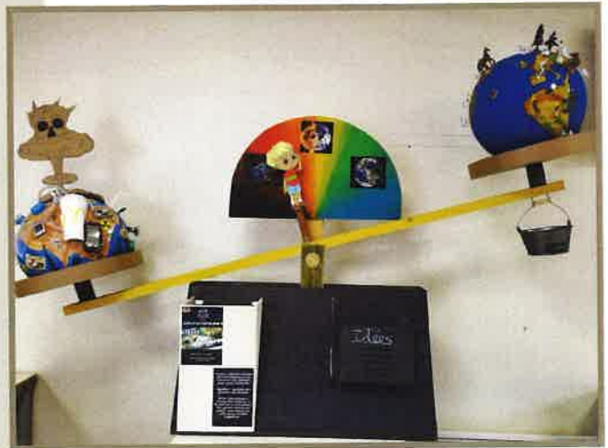
Une fois encore, les enfants ouvrent la voie...

Parce que nous pouvons tous mettre un caillou à l'édifice et que nous sommes tous responsables de notre planète.