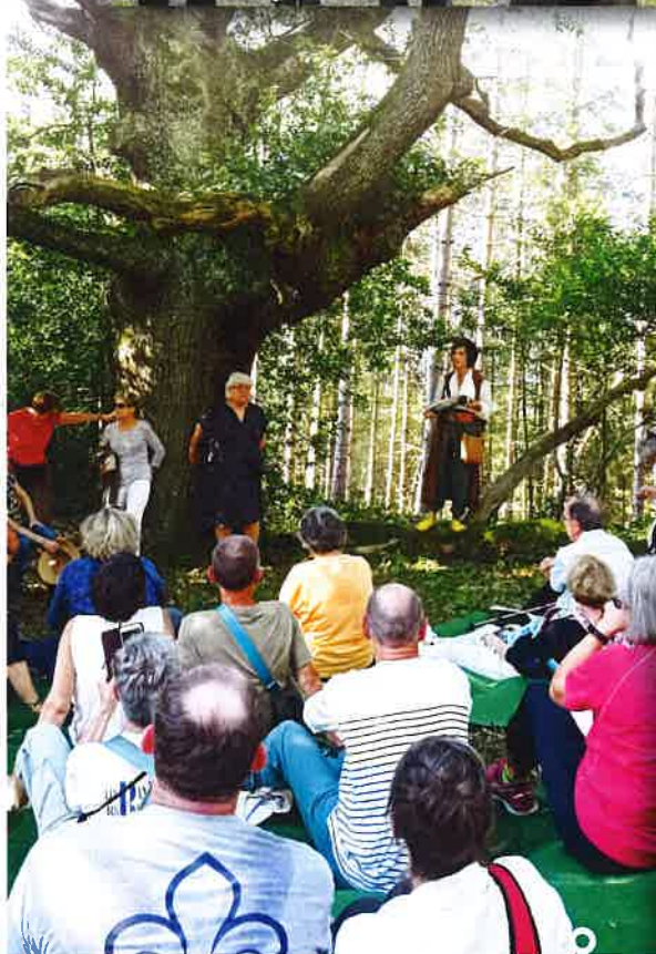
Spectacle aux Chênes de la Buse .....

Il y a un an, je vous annonçais l'annulation de la fête locale pour les raisons que vous connaissez.