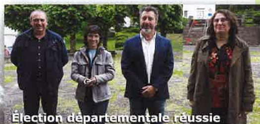
Élection départementale réussie