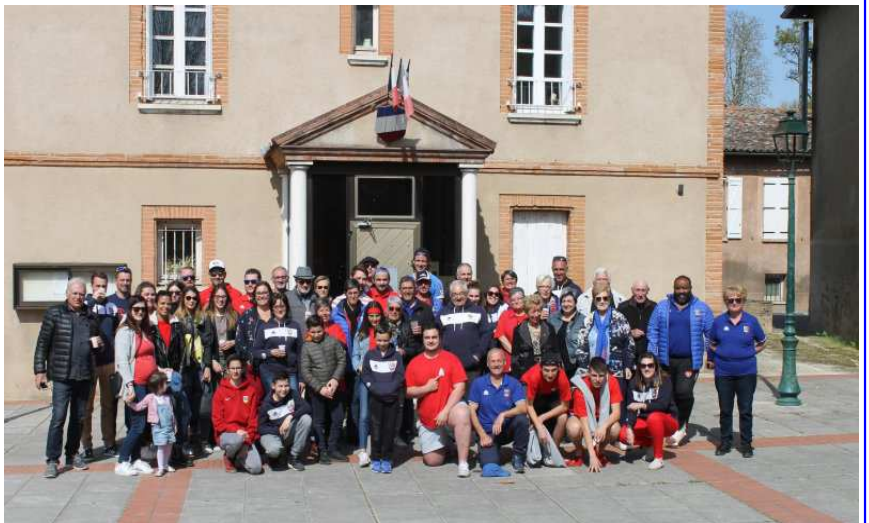
Les supporters devant la Mairie de Montaigut sur Save