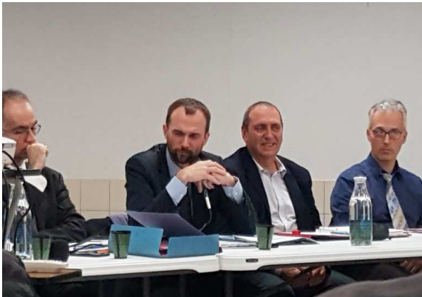
Lors de la réunion publique RN 21 (amiante)