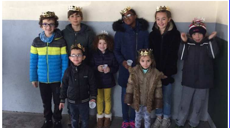
Beaucoup de reines et de rois