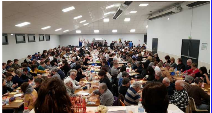
Salle comble au loto de l'U S Adé