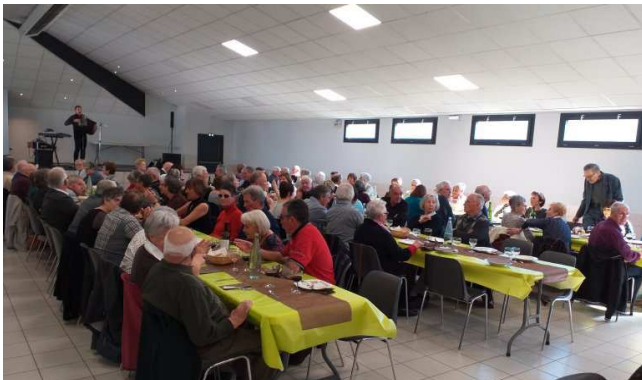
Toujours autant de participants au repas des aînés